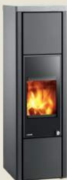
Ligno Aqua Pietra Oilare