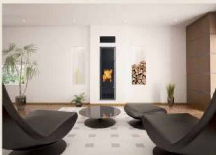
Aqua Insert de Incasso