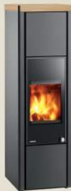
Ligno Aqua Arenaria